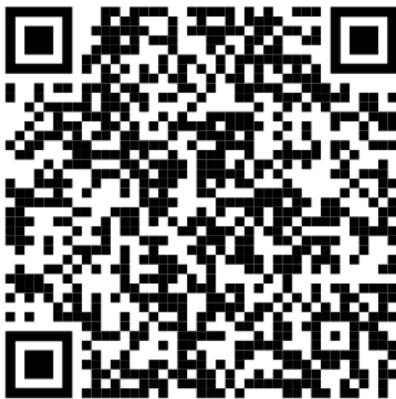
Heinz Erhardt (1909-79), dt. Komiker und Musiker: Vortrag „Ab in die Ferien“